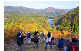
インバウンド観光