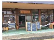
空き店舗リノベーションによるカフェ