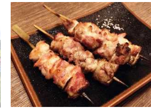
地元食材の活用メニュー