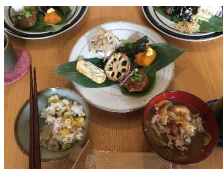
地元料理のアレンジ