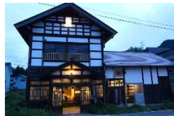
古民家リノベーションによるゲストハウス