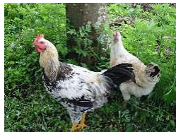
町特産の会津地鶏