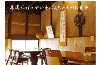
「やいこばあちゃん」店内