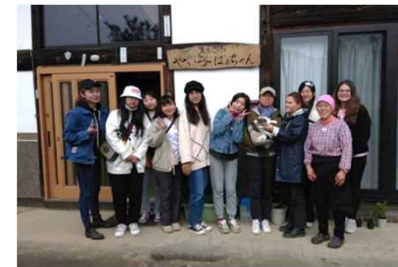
「やいこばあちゃん」留学生のお客さん