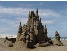
夏のビッグイベント「サンドクラフト」(釜谷浜海水浴場)