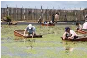
じゅんさい摘みとり体験 (町内7カ所)