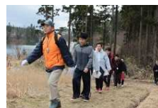
クアオルト健康ウォーキング