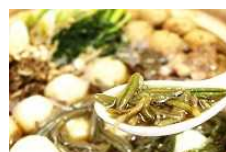
特産のじゅんさいを使った鍋料理