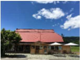
七ヶ宿くらし研究所