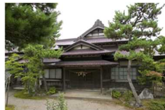
重要文化座「小玉家住宅」