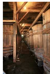
小玉醸造(酒蔵見学)