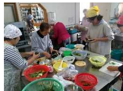
あかつきの会にて研修