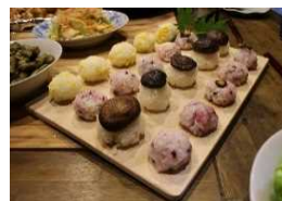
郷土料理をアレンジしたおにぎり