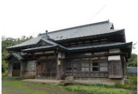
活動拠点となる古民家