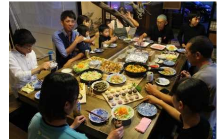
調理体験後の食事会のイメージ