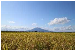
津軽平野から望む岩木山