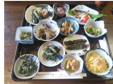
食事提供メニューのイメージ