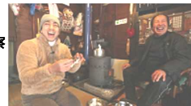
タイ全国放送TV番組撮影