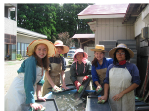
国際交流団体の受入れ