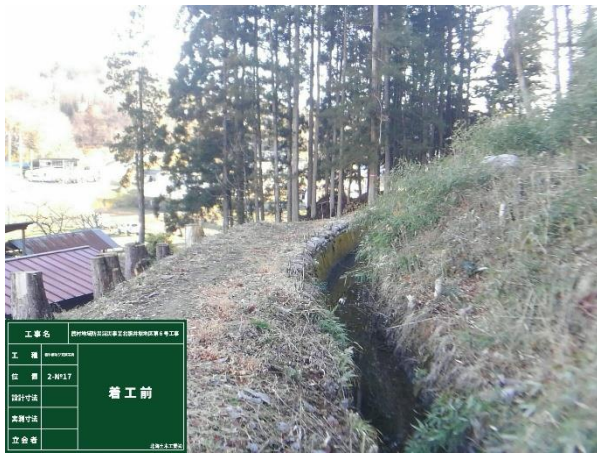
整備前（令和元年12月）