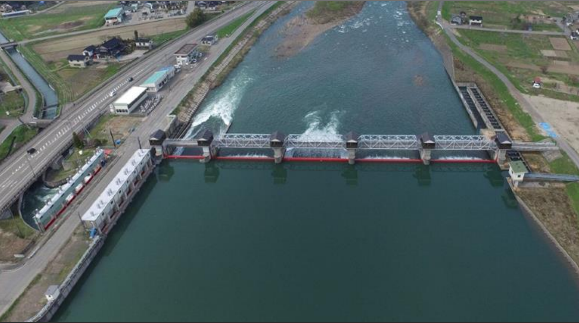
赤川頭首工全景（改修後）