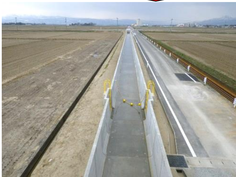
水路断面の拡幅（東3号幹線用水路）