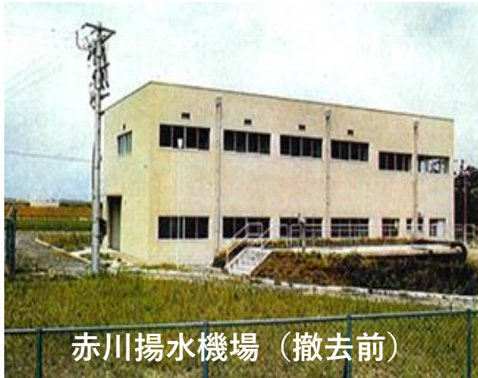
赤川揚水機場（撤去前）