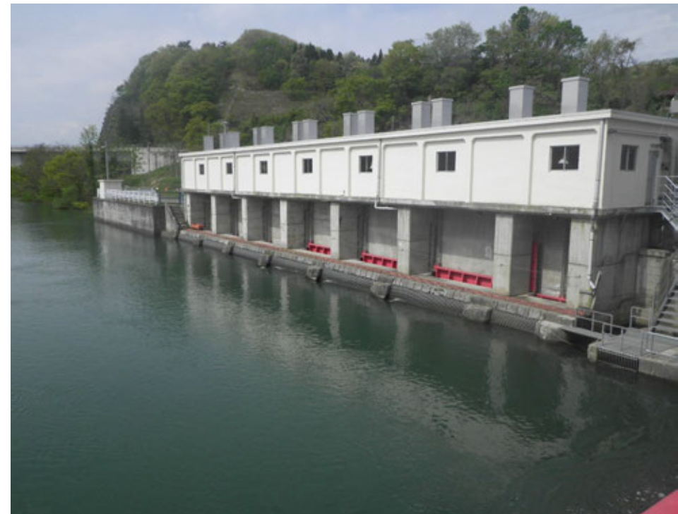
取水・制水ゲート設備の更新