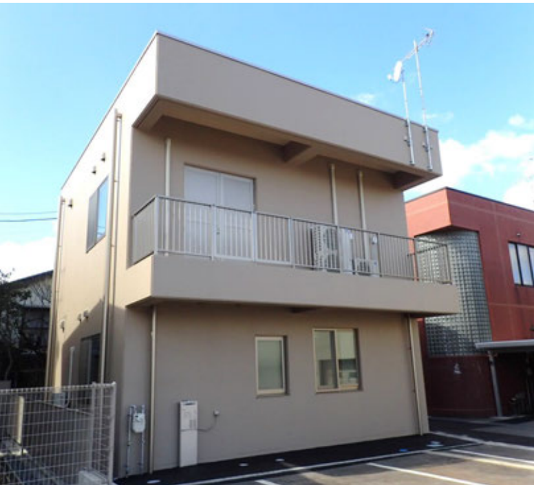
赤川用水管理センター