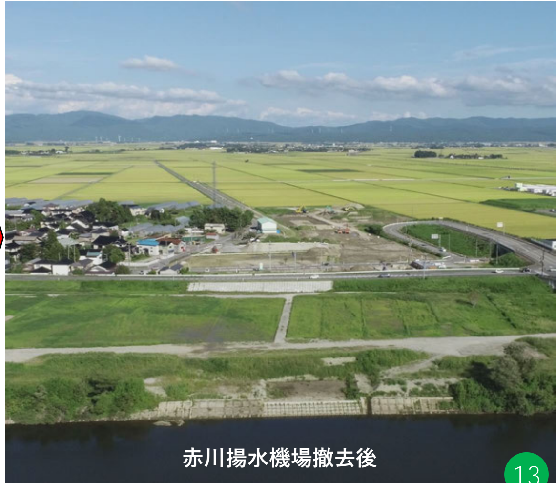
赤川揚水機場撤去後