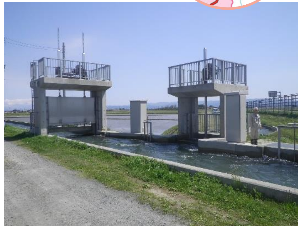
分水工の改修（東五ヶ村分水工）