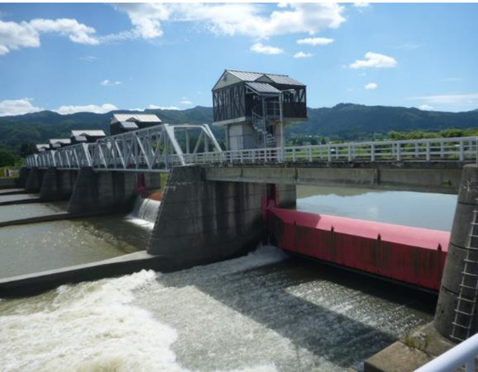
土砂吐・洪水吐ゲート設備の更新