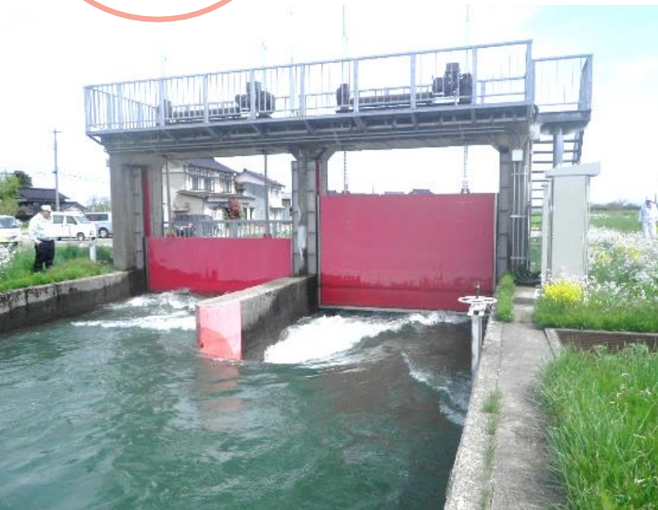
ゲート設備の整備（板井川分水工）