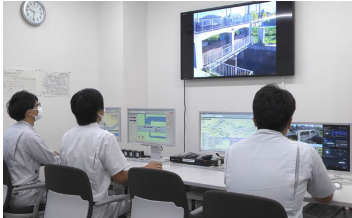
赤川用水管理センター（操作室）