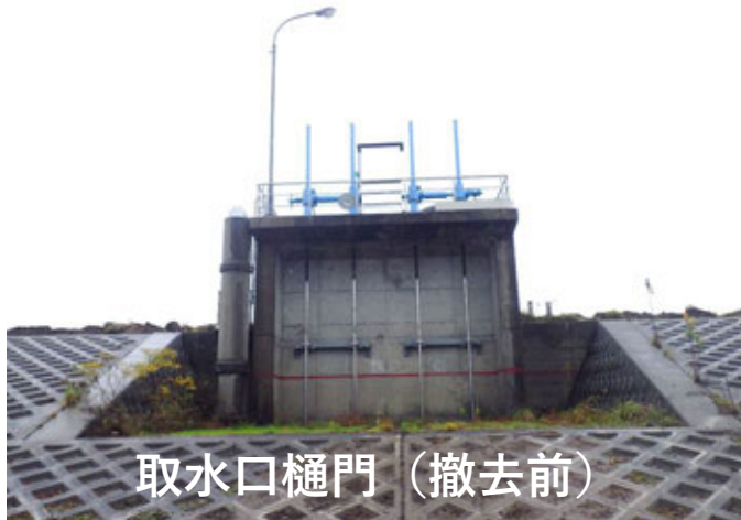
取水口樋門（撤去前）