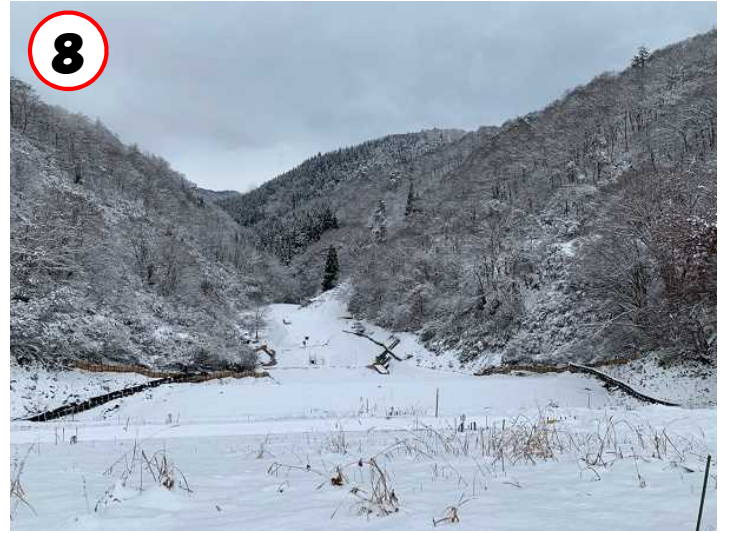
⑧越冬時の状況(ダム天端から望む) (R4.12.7撮影)