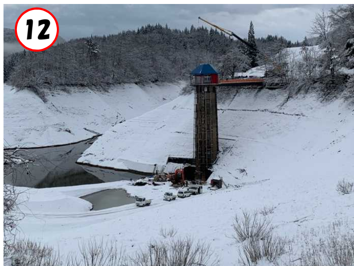
⑫越冬時の状況(ダム天端から望む) (R4.12.7撮影)