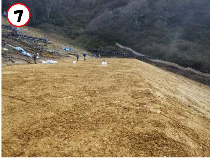
⑦堤体盛土完了時(初年度分)の状況 (ダム右岸側から望む)(R4.11.21撮影)