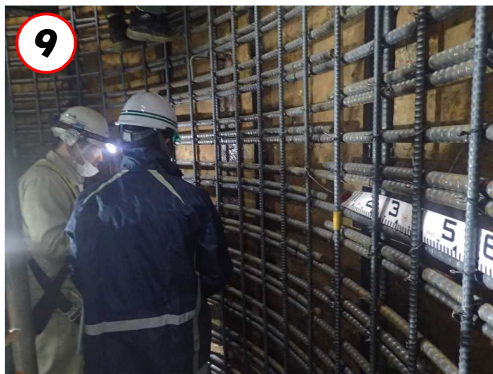
⑨取水塔内部の状況(底部増打ちコンクリート配筋) (R4.10.25撮影)