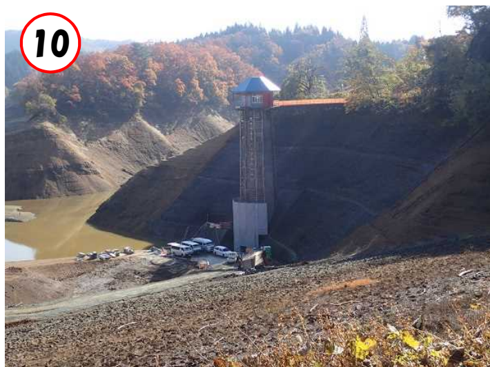
⑩取水塔耐震補強工事の状況(ダム天端から望む) (R4.11.11撮影)