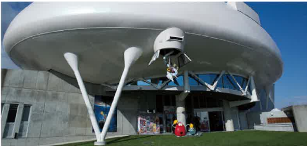
石ノ森萬画館外観

平成17年4月1日には石巻地域1市6町が合併し、新・石巻市として 新たなスタートを切りました。