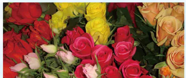
南郷地域のバラは市場における価値が高い

奥羽山系を源とする鳴瀬川・江合川が町内を貫流し、この水利に恵 まれた農業が、町の基幹産業となっています。土地は平たんで、約 75km 2 に及ぶ町の面積の約70%を豊かな水田や畑が占めています。 宮城県の食糧基地として、コマや野菜はもちろん、果樹や施設園芸も たいへん盛んです。