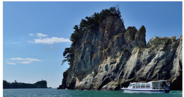
日本三大川のひとつ「嵯峨溪」

東北のゲートウェイ・仙台市からも約1時間の圏内で、三陸自動車 道やJR仙石線、国道45号線が市内の東西に走り、気軽に来れるアク セスの良さも魅力のひとつです。