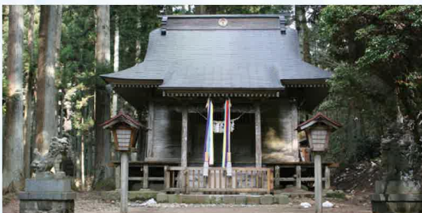
史跡黄金山産金遺跡

町内の主な観光スポットは、砂金採り体験ができる「天平ろまん 館」の他、奥州三観音の一つとして有名な籠岳観音が祭られる「籠峯 寺」、日帰り温泉施設「わくや天平の湯」などです。特産は、小ねぎやホ ウレンソウ・水菜などで、小ねぎは、関東以北で最大の産地となっ ています。とろけるような食感のおぼろ豆腐やシイタケを使った郷土料 理「おぼろ豆腐汁」の優しい味わいが観光で訪れる方に好評です。