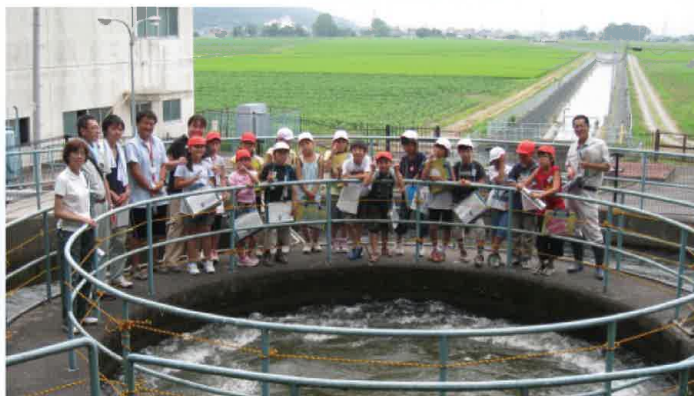
前谷地揚水機場(円筒分水工)