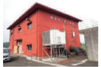
▲中央管理所からの操作ができない排水機場（機側操作形態）