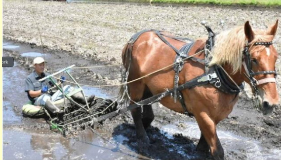
障がい者による馬耕の実施