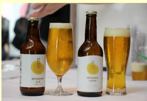
泡まで黄色い2種類の紅花クラフトビール