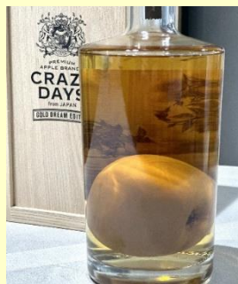
りんごが瓶の中に入っているブランデー