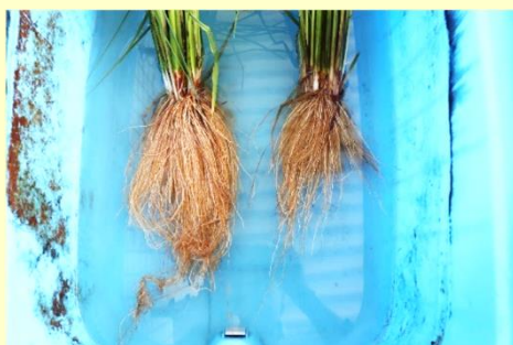
左：新肥料使用 左：普通栽培