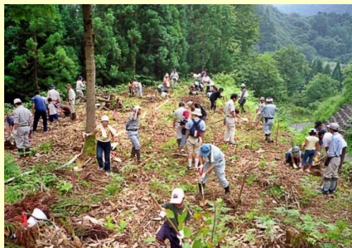
地元小学生たちとの植樹活動