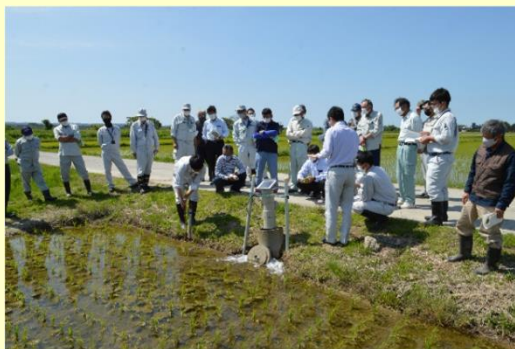
国営ICT事業実施地区の現地視察状況