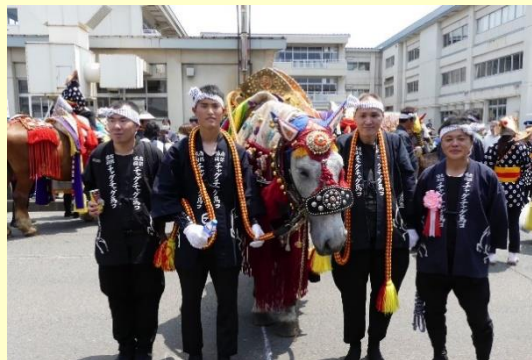
障がい者とのチャグチャグ馬コへの参加