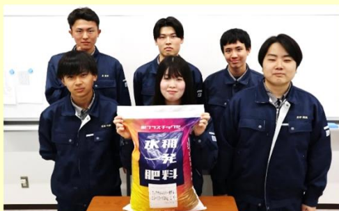
新肥料を肥料会社と共同開発。特許申請中