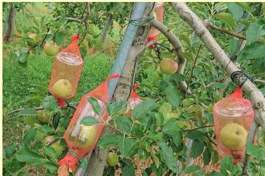
瓶の中でりんごを育てている様子