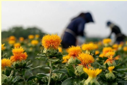
会員生産法人で生産されている紅花