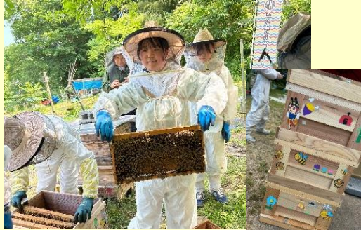
不登校特例校との養蜂活動