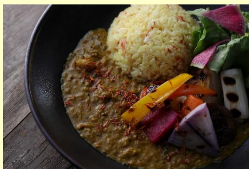
テスト販売した紅花カレー