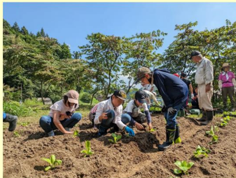
みつばちの里の蜜源活動