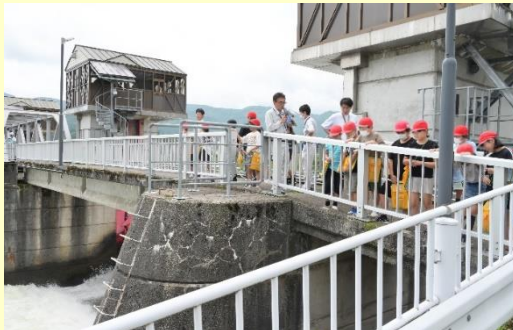
地元小学生へ頭首工の説明(水利施設探訪)