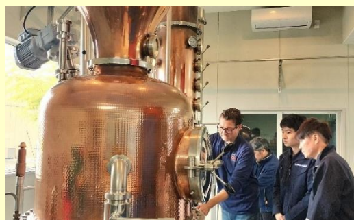
ドイツ人技師による製造技術のトレーニング