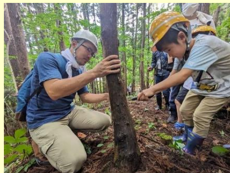
山のがっこうの林業活動