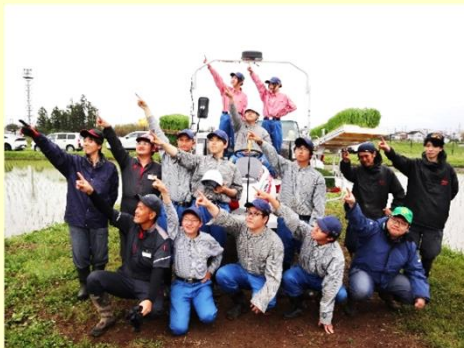
新肥料を新装備を使用して田植え