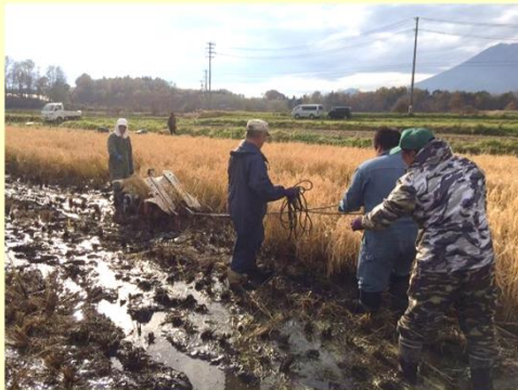
障がい者と職員による稲刈りの様子