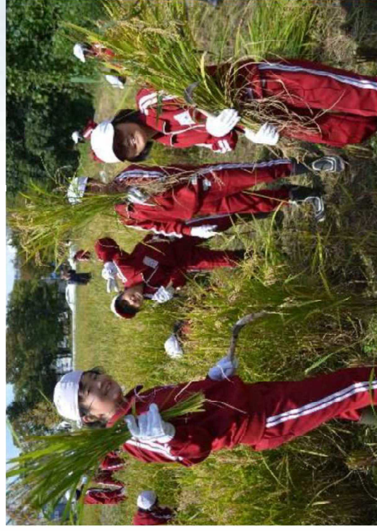
黄金色に実った稲の刈り取り