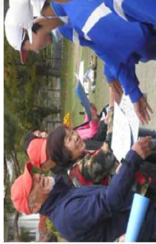
収穫祭で農業科支援員へ感謝の手紙と握手