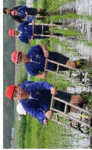
力が必要な田押し車による除草