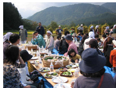
写真3 食べ手との稲刈り交流会

交流会を通じて、「食べ手」が自然環境のすばらしさや米作りの苦労に対して理解を深めることにより、「作り手」と「食べ手」の米に対する価値観の共有と信頼関係が築かれ、販売価格に対しての理解にもつながっている。