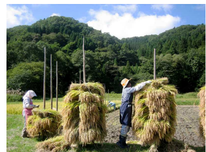
写真2 くい掛け風景

米づくりが安心してできることにより地域の田園風景が守られ、特に鬼首地区には、現在はあまり見られなくなった広大な「くい掛け」の風景が残っており、鳴子温泉地域の景観維持にも大きく寄与している。