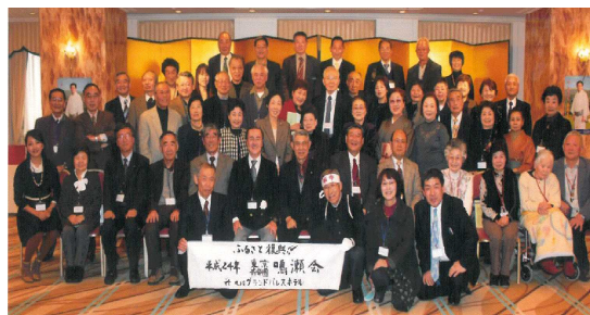
写真3 首都圏鳴瀬会との交流

平成17年1月に地区出身者で発足した「首都圏鳴瀬会」の会合に代表団を毎年派遣し、交流を深めている。また、季節の農産物や加工品を宅配便で届ける「ふるさと宅急便」を通じた物流の交流も年々拡大している。「ふるさと宅急便」には、地区の新聞や学校新聞などふるさとの便りも添え、地区出身者から喜ばれている。