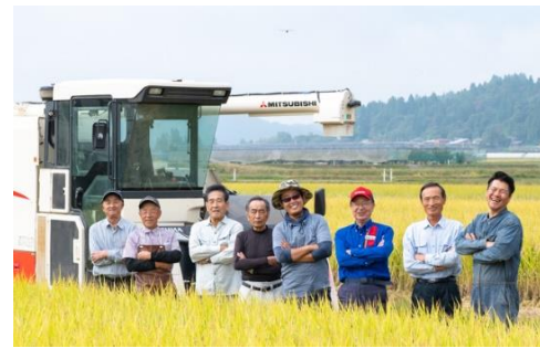
西里ファームの皆様