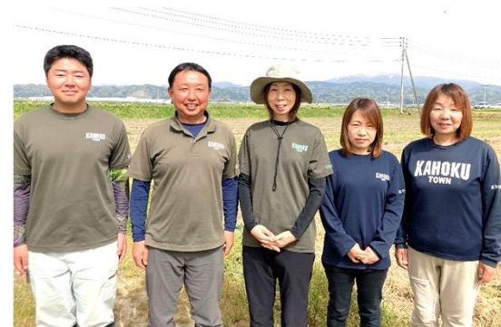
まきの農園の皆様