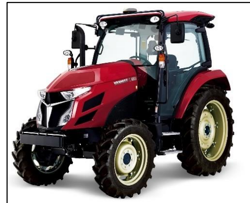
自走操舵トラクタ