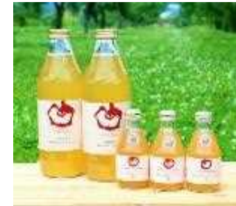
自社製りんごジュース

自社生産のりんごを活用した加工品（ジュース、ネクター、ドライりんご、カットりんご）を開発・製造し、既存の販路を中心に付加価値のある商品を販売し、収益性の向上を目指す。