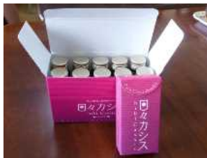
カシスドリンク、顆粒

自ら生産したカシスを使用した加工品（顆粒、ドリンク）を開発し、インターネット販売及び委託販売等に取り組むことで、オリジナルブランド化を進めるとともに、高付加価値化を実現することにより、障がい者の就労支援事業における農業経営の改善を図る。