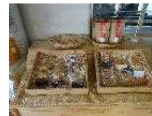
アップルパイ・焼き菓子

平成21年に青森県の助成事業を活用したことをきっかけに、本格的に体験型観光農業事業を展開することとし、農園でとれる果物及び地元農産物を活用したスイーツ、ジェラート、フルーツソース等の加工商品を開発し、自社の直売所や農園カフェにおいて通年販売を行うとともに、農園の食材を活用した料理メニューを開発し、農園レストランで提供する。