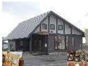
ベジキッチンまいまい

自家生産農産物を材料としたおにぎり、弁当、惣菜を製造し店頭販売する。また、農繁期には地域の農業者向けに田畑まで届けるサービスを行い、農産物に付加価値を付けて農業所得の向上を目指すとともに、地域コミュニティの拠点となるよう取り組む。