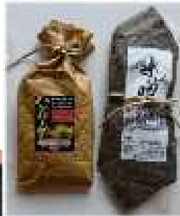
野菜ハンバーグ 豚肉味噌漬け