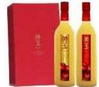
神玉りんごジュース

自ら生産したりんごのうち良質なものを選別し、プレミアムなりんごジュースを製造するとともに、販売ルートを構築することにより、農業経営に付加価値をとりこむことで農業経営の改善を図る。