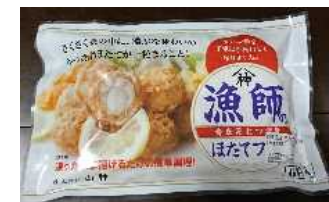
漁師のほたてフライ

自社養殖ホタテを利用した加工品（フライホタテ）を製造・販売するとともに、品質管理の高度化に取り組むことにより、漁業経営に付加価値を取り込み経営の改善を図る。