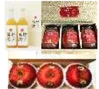
神々のりんご、ジュース 農薬不使用りんごジャム

無農薬、無化学肥料により生産したりんごを使用し、カットりんご、サプリメント商品の開発・製造を行い、健康食品を扱う会社などに販売するとともに、直売やネット販売を新たに導入する。