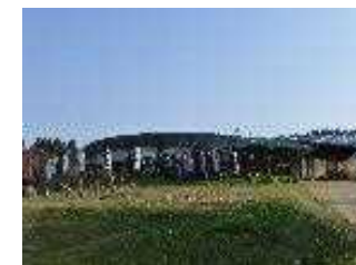
まきばレストラン

自ら生産したハーブや小麦、エディブルフラワーを使ったメニューを農家レストランで提供するとともに、併設する直売所で販売する。また、農園にて収穫体験を行い、グリーン・ツーリズムを含めたレストラン運営を行う。