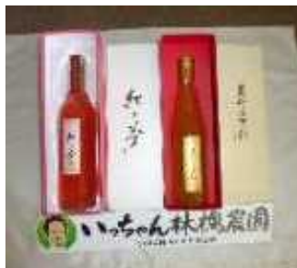
贈答用りんごジュース

自ら生産したりんごを活用したりんごジュース、アップルフレッシュ、カットりんごの開発・販売に取り組むことで農業所得の向上につなげる。