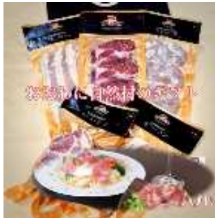
生ハム ギフトセット