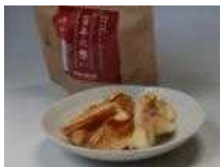
干しりんご「百年の想い」

自社生産果実の加工商品開発、りんごのブランド化及び海外輸出による販路拡大等に取り組むことにより、経営の維持・発展を図る。