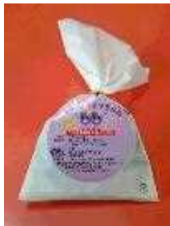
カシス生キャラメル

自社で生産するカシスの加工品（カシス生キャラメル、カシスアイス、カシスジュース）を製造・販売することにより、新たな事業を創出し、農業経営に付加価値を取り組むことで、農業経営の改善を図る。