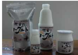
牧舎のヨーグルト

自家産牛乳を用いて、老化による骨密度の減少や肌状態の劣化抑制作用を有する特許乳酸菌（H61株）を活用したヨーグルト製品を開発し、自ら経営する店舗での販売やデパート等への卸売販売、インターネット販売を行うことにより、所得の向上と雇用の創出を図る。