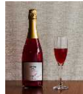
スパークリングワイン

醸造設備を整備し、市場・顧客ニーズの高いスパークリングワインの商品開発及び販売を通じ、「自園自醸ワイン紫波」ブランド商品の新たな需要開拓と売上拡大を図ることで、醸造用ワイン用品種ぶどうの栽培を増やし、自園及び周辺地域の生産者の所得を向上させる。