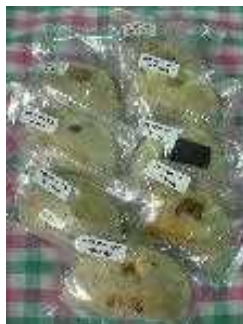
かまやきベーグル

新たに加工施設を増設し、自ら生産する野菜(南瓜、玉葱)、豆類と地域特産品の小麦(ナンブコムギ)及び米(ひとめぼれ)を原材料とした、新商品「おやき」を開発し、直売施設への出品・販売等により、経営の多角化・高度化及び、農業経営の改善を図り地域農産物の生産増加を促進し、雇用創出を目指す。