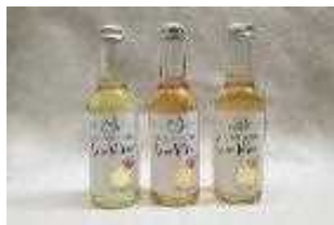
シードル (ノンアルコール)

当会の生産しているりんごを活用した加工品（シードル（ノンアルコール）、ジュース）を製造し、ネット販売及び福祉関係のルートを活用した販売等に取り組むことにより、当会における農業経営の安定化を図る。また、福祉施設と農業を結び付けることにより、障がい者の所得向上と地域農業との連携を目指す。