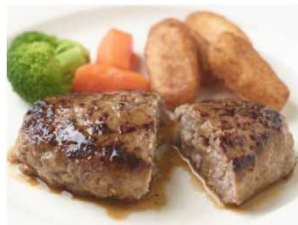
岩手短角牛と佐助豚の コラボハンバーグ

いわて短角牛を使用した新たな加工食品（ハンバーグ、ミートボール、缶詰）を開発し、販売については、既存の取引先である県内の百貨店、スーパー等に販売するとともに、販路拡大にも取り組む。