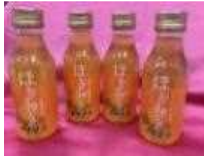
ほおずきんちゃんドリンク

自社で生産した食用ほおずきを使用して、ドリンク、ケーキの開発・製造を行い、デパート、道の駅等で販売する。また、原料確保の安定化に向け、食用ほおずきの水耕栽培を導入する。