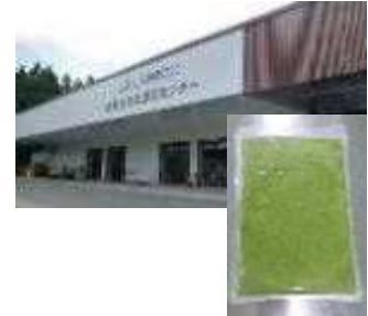
加工所と枝豆ペースト

組合員が生産したえだまめ、アスパラガス、山の芋の規格外品を原料に、食品事業者から要望があるペースト加工品（枝豆ペースト、アスパラガスペースト、山の芋ペースト）を製造・販売することにより、雇用の創出と生産者の農業所得の向上を図る。