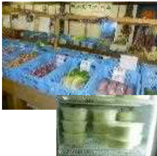
直売所と寄せ豆腐

自社生産の大豆を利用した加工品（豆腐、厚揚げ豆腐、おからがんもどき、おからドーナツ、おからパウダー）を製造し、直売所及び移動販売車による販売に取り組むことにより農業経営の安定と付加価値の向上を目指す。