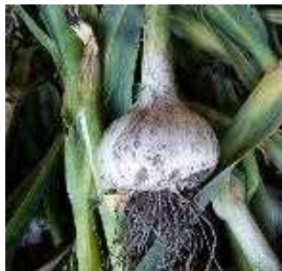
ジャンボニンニク

組合で生産するジャンボにんにくを使用したドライパウダー調味料、ハタハタ寿司を開発するほか、クレソンと米粉を練り合わせたパスタを開発し、直売所やインターネットで販売する。また、ジャンボにんにくは中国やロシアへ輸出も行う。