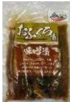
おふくろ漬（味噌漬）

耕作放棄地の解消と自社で発生する鶏糞を使用して生産する野菜の収量の増加とコスト削減を図るとともに、漬物、カット野菜、冷凍カット野菜を製造し、食品販売事業者や地元学校給食等への販売を行い、雇用の創出と経営の安定化を図り、農業経営の改善を目指す。