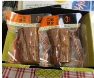
いぶり大根漬け（ハーフ）

自社生産の大根の規格外品を用いて添加物を使わない食べきりサイズのいぶり大根漬け（ハーフ、スライス）とスライス業務用の商品を開発し、食品卸会社や通販会社に販売することにより、所得の向上と雇用の創出を図る。