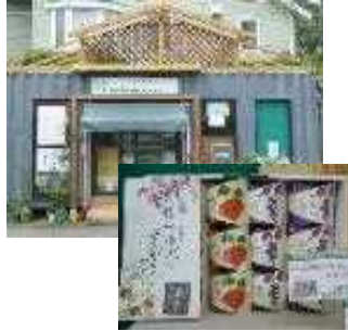
直売所と「こはぜとほおずきゼリー」

「こはぜ」、「食用ほおずき」を原材料とした加工食品（飲料、飲むゼリー）を開発・製造し、インターネットショッピングサイト及び直売所を整備して販売する。