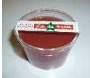
小さいトマトのカクテルゼリー 「ジュレdeキャロル」

自家生産及び地域の農業者が生産した野菜（ミニトマト、さつまいも等）を利用した加工品（ジュレ、ジャム、菓子）を製造し、直売所での販売や食品取扱店への卸売に取り組み、収益の向上を目指す。