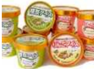
枝豆アイス、りんごアイス

組合員が生産した農産物（野菜、果樹）を使用した加工品（アイス、漬物類）を製造することによる付加価値販売に取り組むことで、組合員の農業所得の向上及び雇用の創出に寄与する。