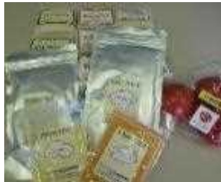
米、乾燥野菜粉粒、 大玉高糖度トマト

自社及び構成員らが生産した米、野菜（トマトやホウレンソウ等）を利用した加工品（無洗米、トマトジュース、乾燥野菜粉粒）を製造し、直売に取り組むことで、付加価値の創造を図る。