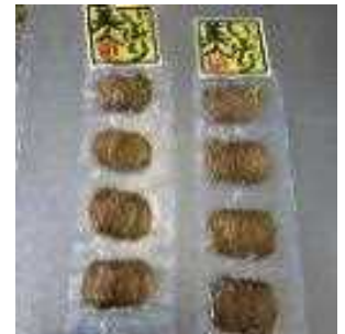
いぶり大根漬スライス

自社及び委託で生産する大根を原料に、食品添加物を使用しない自然素材にこだわった食べきりサイズの新商品（いぶり大根漬、いぶり大根漬スライス）を開発し、取引先であるコープあきた等へ販売するほか、インターネットでの販売を行うことで、新たな雇用の創出と経営の安定を図る。