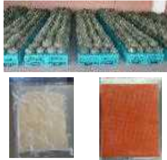
大豆クラッシュとにんじんペースト

自ら生産する野菜、大豆を原料に、ペースト状の野菜冷凍加工品（にんじん、カボチャ、ブロッコリー）及びクラッシュ状の冷凍大豆加工品を開発し、学校給食、病院・介護施設、食品加工業者等への販売に取り組み、地元農産物の付加価値の向上と生産、販売の拡大を図る。