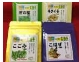
こごみ粉末茶、こはぜ粉末茶、 キクイモ粉末茶、笹の葉粉末茶

高温セラミック熟成乾燥による野菜、山菜等の乾燥品、粉末及び粉末を利用した加工食品を開発する。また、自社ホームページを栽培履歴、料理方法等の情報の提供を行えるようリニューアルし、ネット販売の強化を図る。