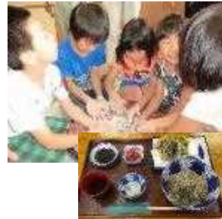
そば打ち体験と「そば定食」

自社生産した果実、野菜等を活用した加工品（乾燥果実）及びレストランメニュー（カレー、ピザ、ドーナツ等）を製造・提供することにより、経営の多角化・安定化に取り組み農業経営の改善を図る。