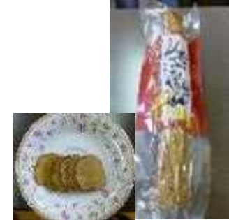
山内いぶり大根漬け

自組合生産のだいこんを用い、添加物を使わない、食べ切り・使い切りサイズや味のバリエーションを増やした新商品（山内いぶり大根漬けミニ、山内いぶり大根漬けスライス、山内いぶり大根漬けキムチっこ）を開発し、卸売販売、ネット販売を行うことにより、農業収入の増大、雇用の場の創出を図る。