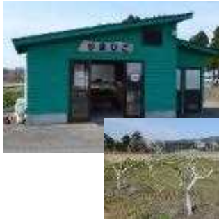
直売所といちじくの苗木

しいたけを原材料とした加工品（味噌、ペースト、漬物）及びいちじくを原材料とした加工品（ジャム、チップス）を開発・販売することで、農業経営の改善を図る。