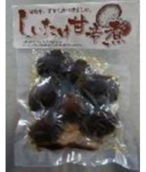
しいたけの甘辛煮

自社生産した菌床しいたけとねぎの規格外品等を活用して新商品（しいたけの味噌煮・キムチ・甘辛煮、スライスねぎ）を製造し、しいたけ加工品は直売所、スーパー等への販売、スライスねぎは飲食店等への販売を行い、経営の多角化と安定的な収益の確保を図る。