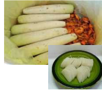
雲然柿で漬けた大根の柿漬け

自社生産する大根及び枝豆を利用した加工品（大根柿漬け、冷凍枝豆ペースト）を製造し、新たな販売ルートを構築し、経営の多角化、高度化を図り、安定的な収益を確保することで農業経営の改善を図る。