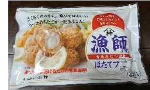
漁師のほたてフライ

自社養殖ホタテを利用した加工品（フライホタテ）を製造・販売するとともに、品質管理の高度化に取り組むことにより、漁業経営に付加価値を取り込み経営の改善を図る。