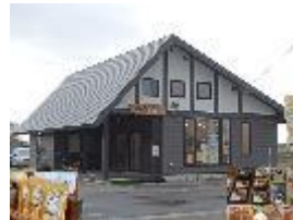
ベジキッチンまいまい

自家生産農産物を材料としたおにぎり、弁当、惣菜を製造し店頭販売する。また、農繁期には地域の農業者向けに田畑まで届けるサービスを行い、農産物に付加価値を付けて農業所得の向上を目指すとともに、地域コミュニティの拠点となるよう取り組む。