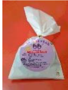
カシス生キャラメル

自社で生産するカシスの加工品（カシス生キャラメル、カシスアイス、カシスジュース）を製造・販売することにより、新たな事業を創出し、農業経営に付加価値を取り組むことで、農業経営の改善を図る。