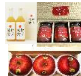
神々のりんご、ジュース 農薬不使用りんごジャム

無農薬、無化学肥料により生産したりんごを使用し、カットりんご、サプリメント商品の開発・製造を行い、健康食品を扱う会社などに販売するとともに、直売やネット販売を新たに導入する。