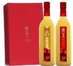
神玉りんごジュース

自ら生産したりんごのうち良質なものを選別し、プレミアムなりんごジュースを製造するとともに、販売ルートを構築することにより、農業経営に付加価値をとりこむことで農業経営の改善を図る。