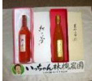
贈答用りんごジュース

自ら生産したりんごを活用したりんごジュース、アップルフレッシュ、カットりんごの開発・販売に取り組むことで農業所得の向上につなげる。