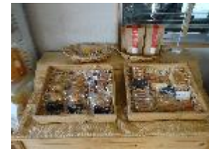
アップルパイ・焼き菓子

平成21年に青森県の助成事業を活用したことをきっかけに、本格的に体験型観光農業事業を展開することとし、農園でとれる果物及び地元農産物を活用したスイーツ、ジェラート、フルーツソース等の加工商品を開発し、自社の直売所や農園カフェにおいて通年販売を行うとともに、農園の食材を活用した料理メニューを開発し、農園レストランで提供する。