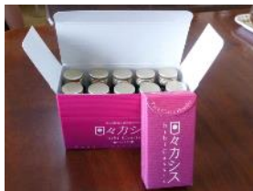
カシスドリンク、顆粒

自ら生産したカシスを使用した加工品（顆粒、ドリンク）を開発し、インターネット販売及び委託販売等に取り組むことで、オリジナルブランド化を進めるとともに、高付加価値化を実現することにより、障がい者の就労支援事業における農業経営の改善を図る。