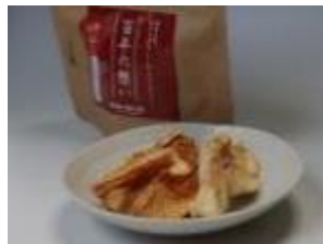
干しりんご「百年の想い」

自社生産果実の加工商品開発、りんごのブランド化及び海外輸出による販路拡大等に取り組むことにより、経営の維持・発展を図る。