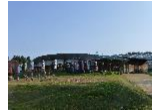
まきばレストラン

自ら生産したハーブや小麦、エディブルフラワーを使ったメニューを農家レストランで提供するとともに、併設する直売所で販売する。また、農園にて収穫体験を行い、グリーン・ツーリズムを含めたレストラン運営を行う。