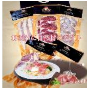
生ハム ギフトセット

自社生産豚肉を利用し試作してきた生ハムを商品化し、全国のホテル、飲食業界等へ販売することにより、高付加価値な豚肉加工品製造と販売を新たな経営基盤の柱にすることで、農業経営の改善を図るとともに、地域ブランド化を目指す。