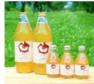
自社製りんごジュース

自社生産のりんごを活用した加工品（ジュース、ネクター、ドライりんご、カットりんご）を開発・製造し、既存の販路を中心に付加価値のある商品を販売し、収益性の向上を目指す。