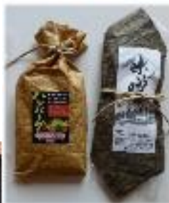
野菜ハンバーグ 豚肉味噌漬け