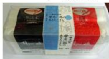
あきたこまちの無洗米 (一等米100%)