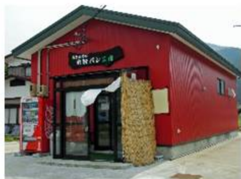
忠さんちの米粉パン工房

(株)相川ファームでは、米、さくらんぼを生産しており、インターネット等での直売やJA等へ販売しているほか、輸出等も検討しています。