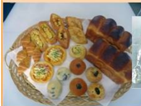
豊富な種類の自家製米粉パン