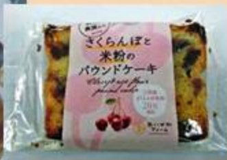
さくらんぼと米粉の パウンドケーキ