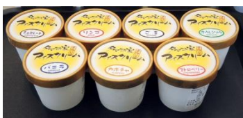
手作りアイスクリーム