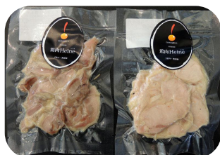
鳥ハム「鶏肉ハイン」