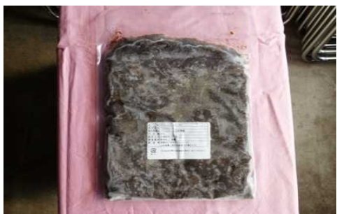
マッシュルームペースト