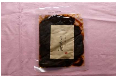
マッシュルームのうま煮

マッシュルームがもたらす小さな幸せを多くの食卓に届けてみんなを笑顔にしたい。との、願いを込めてマッシュルームや加工品のネット販売も行っています。