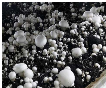
マッシュルームの発生