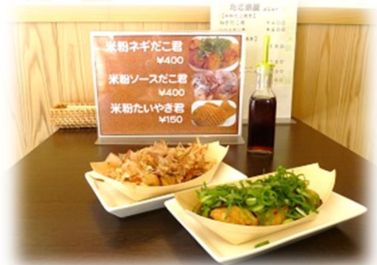
米粉ソースだこ君(奥)と米粉ネギだこ君

今では、米粉たこ焼きファンも増加し、県内はもちろん、首都圏でのイベントにも引っ張りだこの状態です。