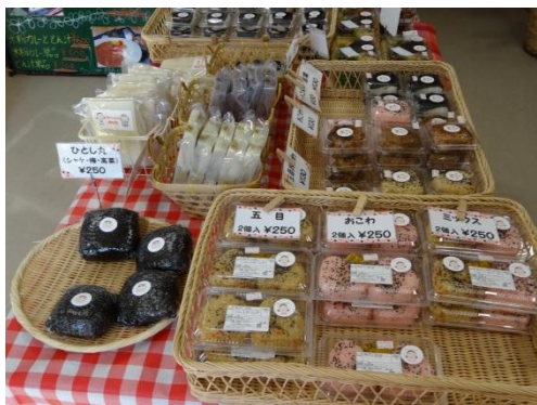
おにぎりなどの販売コーナー