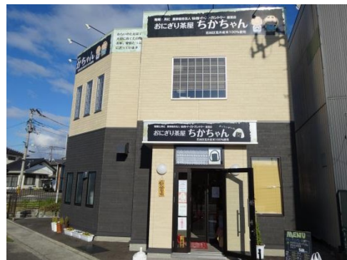
おにぎり茶屋 ちかちゃん

仙台イーストカントリーと神屋敷仕込みそクラブでは、平成25年5月に仙台市若林区内に「おにぎり茶屋ちかちゃん」をオープンしました。