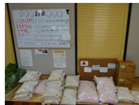
お米販売コーナー