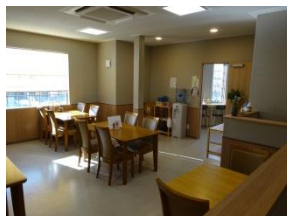
2階の食事スペース