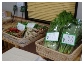
野菜販売コーナー