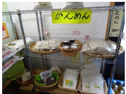
そば乾麺やそば粉、お米も販売