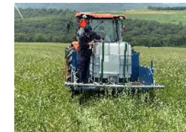
牧草地での散布実証