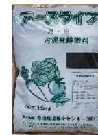
汚泥発酵肥料 アースライフ