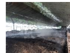
アースライフ製造