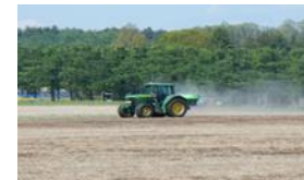
大地くん散布 (ブロードキャスター)