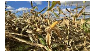
国産子実トウモロコシ