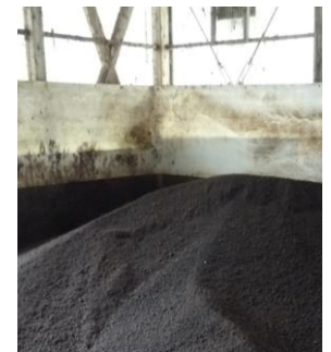
九戸たい肥1号 (バラでの提供)