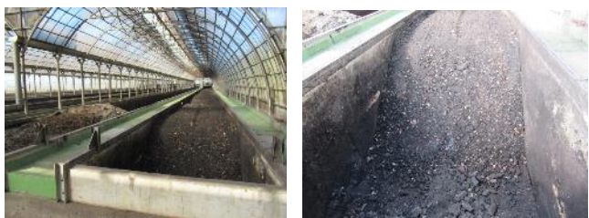
ハザカプラントの様子 左：発酵槽 右：発酵槽廃棄物投入口