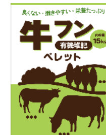
ペレット堆肥 パッケージ（案）