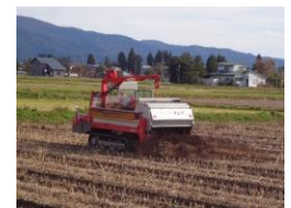
散布作業の様子 (マニユアスプレッター)