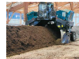
攪拌作業の様子 (トップターン方式)