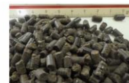
▲ペレット化試験品(4mm目)