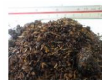
▲鶴岡コンポスト従来品