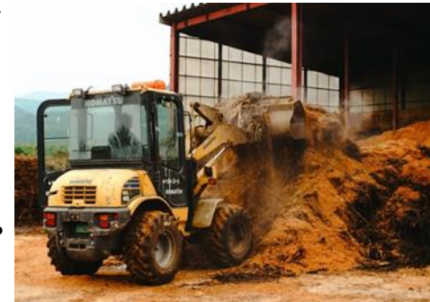
ホイールローダーでの堆肥切り返し