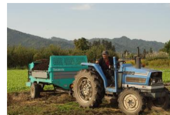
マニュアルスプレッダによる散布