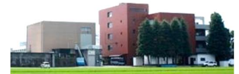
施設全景 （左）発電所 （右）土地改良区