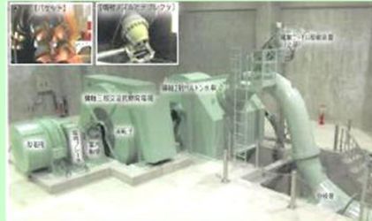
(右) 横軸単輪二射ペルトン水車 (左) 横軸三相交流同期発電機 (2階)