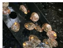
アワビの増殖技術