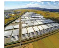
亘理町浜吉田団地