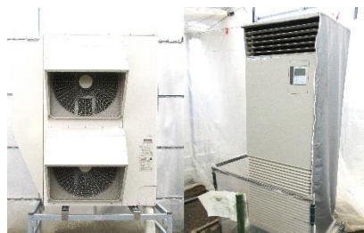
寒冷地向けヒートポンプ

南東北エリア以南ではヒートポンプのみでの加温が可能と考えるが、夏季の冷房にも使用する場合、年間のエネルギー使用量は増大する可能性がある。