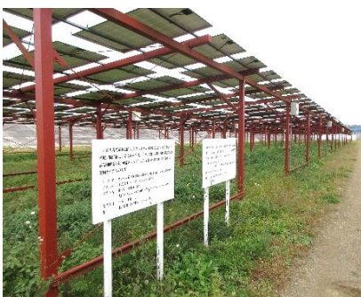
平成31年2月に設置した太陽光発電設備

重油や電気代が年々高騰し経営を圧迫するなか、再生可能エネルギーに着目し、ハウスに隣接する未利用農地への営農型太陽光発電設備の導入に至った。パネルの下でも営農をしている。