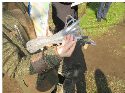
加温に使用している電熱線ヒーター

厳冬・暖冬の影響で年により電気使用量は異なるが、いずれの場合も燃油暖房機を使用していた時の1/3～半分以下にコスト削減でき効果を実感している。