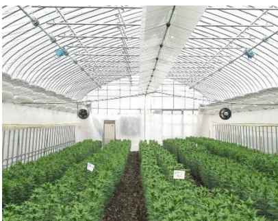
内張りの多層化や循環扇の設置により最新ハウスではヒートポンプのみで加温

なお、デフロスト対策として当初から寒冷地向けのヒートポンプを導入しているが、最近では性能が向上し、デフロスト運転の時間も短くなっていることから、新しく増設したパイプハウスでは、燃油暖房機とのハイブリッド運転ではなくヒートポンプのみで加温している。