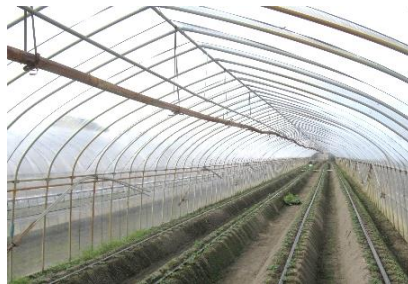
二重カーテンを設置する前のハウス