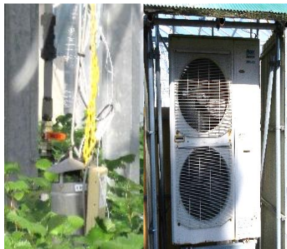
環境測定器(左)と室外機(右)

また、冬季は、ヒートポンプと燃油暖房機を併用することで、燃油暖房機のみを使用するよりも効率的にハウス内の温度を上げることができる。