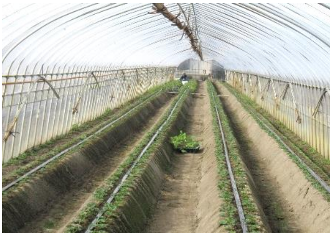
いちごの土耕栽培