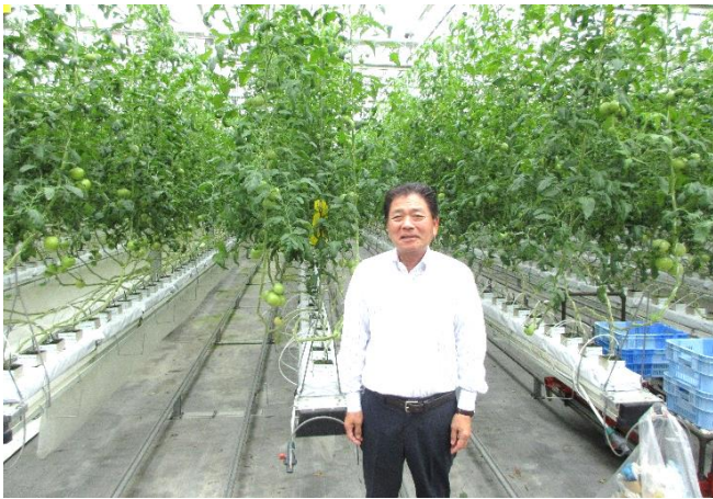
株式会社サンフレッシュ小泉農園の今野代表