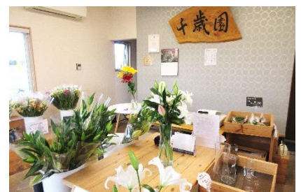
直売所で地元向けにもユリを販売

高温対策として、細霧冷房の導入を検討し、冬季の生産を控えて夏季の夜間冷房による高付加価値生産に注力したい。夜間冷房により電気代が増える(冬季の加温よりは低コスト)が、それをペイできるだけの高単価で販売が可能であり、冬季に加温して低単価で販売するよりも効率がいいと考えている。