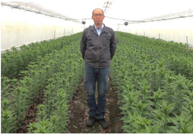
株式会社 千歳園の池野代表