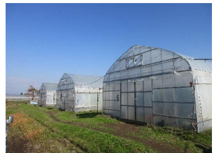
電熱線ヒーターが導入されているハウス

生産者仲間からは興味があるとの話を受けている。自身も取り組んで手ごたえを感じているものの、導入2年目なので、導入コストも含め、もう少し検証していきたい。