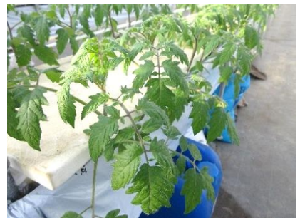
順調に育っているトマト苗

ペレットボイラーと燃油ボイラーの併用ハウスでも生育や品質に問題なく生産できている。