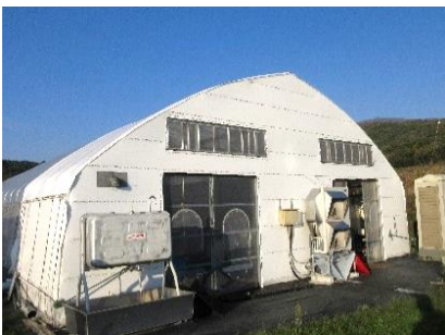
リーフレタスの栽培を行っているハウス

しかし、もみ殻ボイラーは空気を加温することは問題なく、低コストで運用できる加温設備として、非常に有効なものであると感じている。