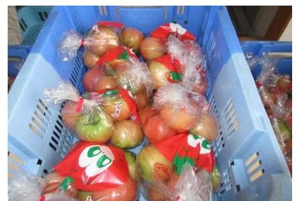
地域の復興と事業運営が波に乗ることを願って命名された「波乗りトマトとまたん」

「当地区の農業を後世に引き継ぐことが自分達の使命」として、飼料用米（21ha）の作付けも行っており、近隣農家から農作業受託の依頼があることから、農地拡大の可能性はある。