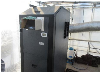
ペレットボイラー

令和元年台風第 19 号の被害でハウスが全滅した際に、支援事業を活用し木質ペレットを使用するバイオマスボイラー (以下、「ペレットボイラー」という。) を整備した。ペレットボイラーはハウス内に設置できるサイズで、横の煙突部から温風が出る仕組みだが、ハウス内が温まるまでに時間がかかるため、燃油ボイラーを併用している。