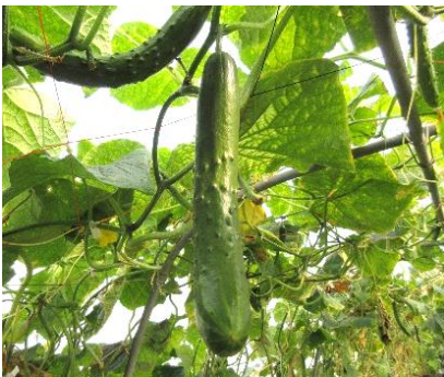
ハウス内で栽培されているきゅうり

きゅうりの端境期出荷としての先行作付のため、定植後の3月～4月に局所加温を活用している。なお、加温は霜害や土壌の凍結を防ぐ目的であるため、室温に対しての加温は行っていない。