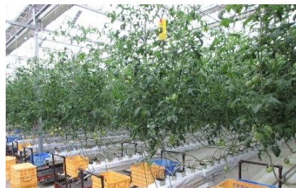
ハウス内のトマトの生育状況

数年前にコナジラミが発生して以降、これまで大きな病害虫の発生はなく、安定した生産量と品質が確保されている。