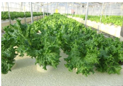
水耕栽培のリーフレタス