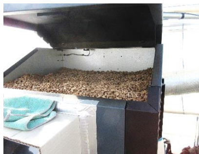
ペレットの補充も容易

加温期間が長い冬季には、燃油ボイラーよりも燃料費を削減できるペレットボイラーの使用は有効である。ペレットボイラーと燃油ボイラーの併用ハウスでの燃油使用量は、燃油ボイラーのみのハウスと比較して半減できている。また、ヒートポンプと燃油ボイラーの併用ハウスも、燃油使用量を半減できている。