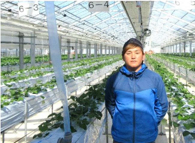
有限会社 アグリフライト大曲の大槻代表