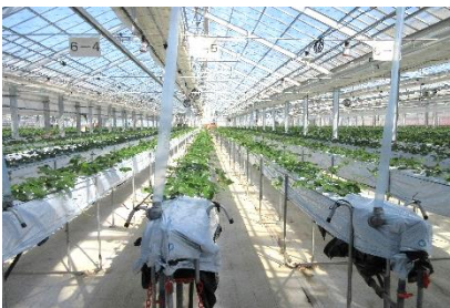
加熱設備は環境制御システムで管理

環境制御システムにより温度、湿度、CO 2 濃度などの環境情報を収集し、換気装置とともに自動制御している。また、温湯ボイラーによる培地の加熱や循環扇の設置による温度ムラの解消も図っている。