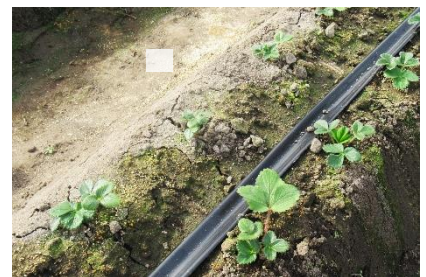
緩やかだが順調に成長

トでの導入が可能である。しかし、ウォーターカーテンは土耕向けの設備なので、高設栽培を希望する最近の新規就農者には人気がないようだ。