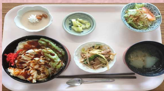
最上伝承野菜（畑なす）を使用したメニュー (令和2年7月)

なお、地産地消定食の食材には市場出荷ができない規格外品を適宜活用しており、食品ロス削減にも取り組んでいます。また、地産地消定食の取組で使用した食材をその場で販売するなど、地元農産物の消費拡大だけでなく、認知度向上を図っています。