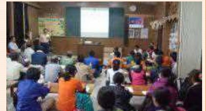
電気さく講習会の様子