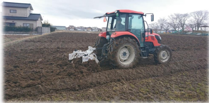
サブソイラー・プラソイラー