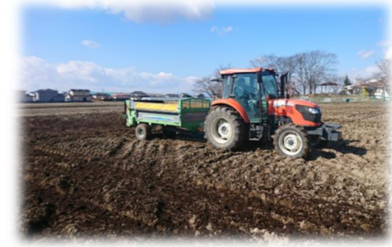
ねぎ残渣堆肥散布