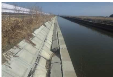
①排水路の被災状況