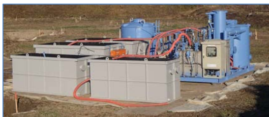
エコシステムによる稼働状況