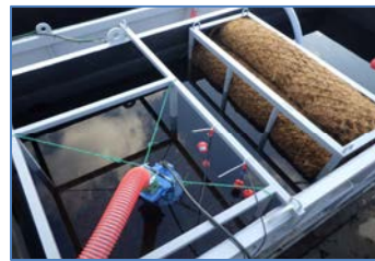
バイオログフィルター設置状況(NETIS登録済)