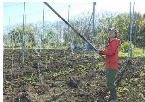
翌年に向けたホップ棚の整理作業

遠野市の寒さにはまだ慣れないようでしたが、地域の人との温かいつながりの中で、充実した生活を送っています。