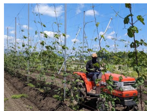
整然と並ぶホップ棚の横を トラクターで中耕

来年は協力隊任期最終年となることから、農地の取得も進めているところで、目標の半分まで準備が整ってきています。栽培技術の習得と並行しながらホップとわさびの栽培を行える土地や住居探しなど、やらなければいけないことは多いですが、夢に向かって進む表情は輝いていました。