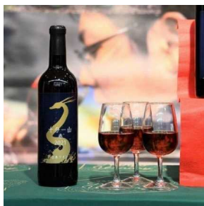
地域が連携し作り上げた ワイン

平成31年に始めた取組は、地元のぶどう農家・酒販売店・高校や南陽市と連携し、15aに4種の醸造用ぶどう苗木を新植し肥培管理するところから行い、令和3年には初収穫したぶどうのみを使用したワインが完成し、ぶどう栽培からワインの製造、販売まで一貫して行うことができました。