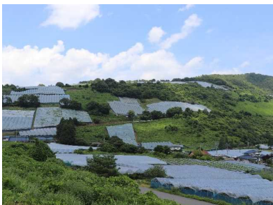
十分一山の風景 (令和4年7月25日現在)

しかし、礫質のため土が少なく、掘り起こせばすぐ石に当たるため、ぶどうの根の張りが悪い。特に新植して1～2年の幼木には手がかかり、樹木枯れを防ぐための急斜面での水やり作業は、軽トラックの荷台に水を入れたタンクを積んで何度も往復しなければならず大変でした。また、去年は鳥やハクビシンによる食害が増加し、電気柵の設置などの対策も必要と考えています。