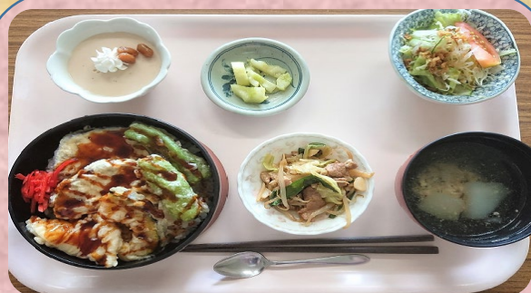
最上伝承野菜(畑なす)を使用したメニュー(令和2年7月)

なお、地産地消定食の食材には市場出荷ができない規格外品を適宜活用しており、食品ロス削減にも取り組んでいます。また、地産地消定食の取組で使用した食材をその場で販売するなど、地元農産物の消費拡大だけでなく、認知度向上を図っています。