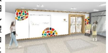
「ココトモカフェ」のイメージ