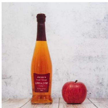
厳選した国産原料を用いた商品